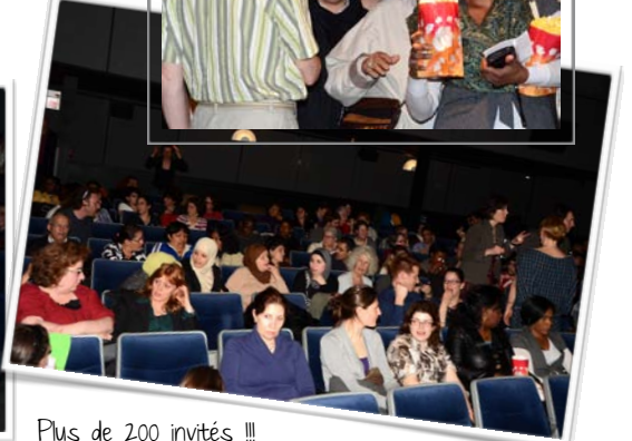
Plus de 200 invités !!!