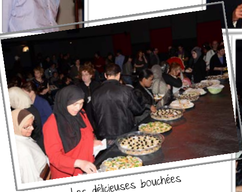
Les délicieuses bouchées