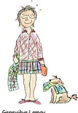
Geneviève Lemay, maternelle à la garderie

Voir le feuillet d'information : "L'hyperactivité et les problèmes d'attention chez les jeunes. Soyons vigilants !" en complémentarité avec ce texte.