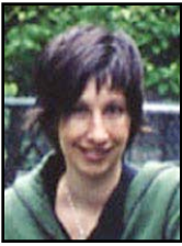
par Violaine Gagnon parent