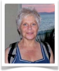
par Martine Bouffange, conseillère à la pédagogie