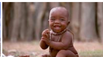
Ponijao Namibie (Afrique Australe)