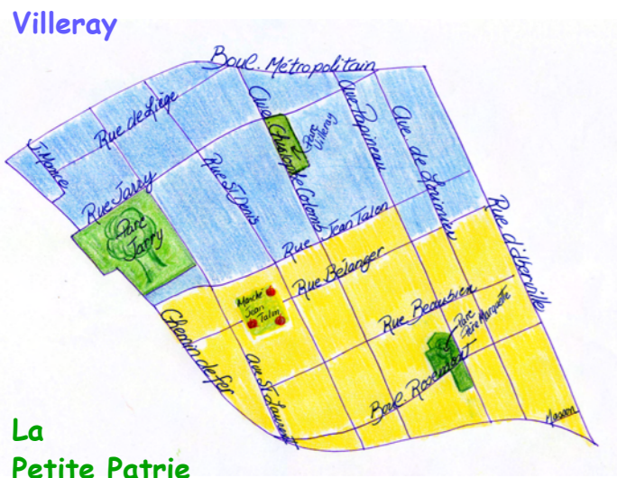
La Petite Patrie