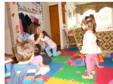
Pour participer aux différentes activités reliées aux comptines, l'enfant doit écouter les consignes.