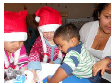
Les comptines favorisent l'adaptation à une nouvelle culture.