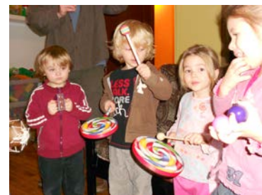
La liberté syntaxique des comptines permet à l'enfant de jouer avec les mots et les sonorités.

Dès son plus jeune âge, l'enfant est capable de taper des mains et de battre des pieds au rythme d'une comptine. Il prend alors conscience des syllabes et des sons et il fait des liens entre eux. En chantonnant, l'enfant apprend à articuler et à prononcer les consonnes de façon plus claire. L'enchaînement des mots permet à l'enfant de faire, de différentes façons, bouger sa langue et la position de ses lèvres sur les dents. Petit à petit, il en arrive à mieux prononcer les sons.