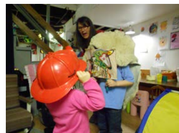
Les comptines permettent de toucher à tous les aspects du développement des jeunes enfants.