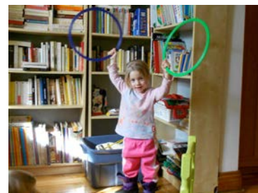
Les comptines permettent aux enfants d'extérioriser leurs sentiments tout en leur permettant de faire de l'exercice.

L'interconnexion des différents éléments qui favorisent le bon développement chez l'enfant, forment une transdisciplinarité dont la responsable de garde doit tenir compte pour établir ce qui peut s'apparenter à un programme éducatif. Elle doit bien connaître chacun des enfants de son groupe, l'observer pour savoir où en est son développement et l'amener, par un programme et des stratégies appropriées à pouvoir se situer par rapport au monde qui l'entoure. Elle doit aussi sans cesse s'ajuster pour améliorer la qualité de ses relations avec les enfants. Les interactions des enfants doivent aussi être de qualité et l'une des fonctions principales de la responsable de garde est d'agir en ce sens.