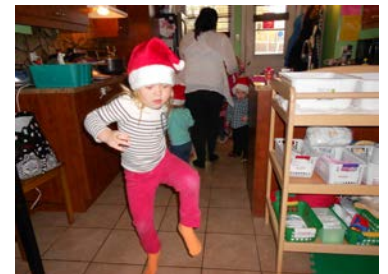
La responsable de garde peut utiliser les compétences de l'enfant expert à des fins éducatives pour les plus jeunes.