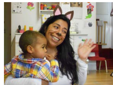
Pour l'enfant, la comptine devient un jouet qui lui procure des sensations agréables.

L'enfant aime la rapidité et le rythme des comptines, leur côté drôle et léger et il s'en sert comme d'un jouet qui lui permet d'appivoiser le langage. Les comptines abordent des sujets graves mais de façon anodine et, de cette façon, elles agissent comme une soupape qui autorise l'enfant à se décharger de ses angoisses et de ses tensions. En chantant, l'enfant éprouve des sensations agréables avec le diaphragme, les poumons, le larynx, les dents, les lèvres, le palais, etc.