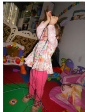
La comptine agit avec l'enfant comme un "doudou" sonore.

On sait maintenant que la relation entre la mère et l'enfant se crée déjà avant la naissance, par le son. Des nourrissons de quelques jours expriment leur préférence pour des comptines chantées par leur mère durant sa grossesse plutôt que des comptines leur étant inconnues. Ils sont capables de décoder les expressions vocales bien avant les expressions faciales. Le rythme simple, régulier et doux de la berceuse Bateau sur l'eau , chantonnée par sa mère, apaise le bébé. Elle lui rappelle des sensations intra-utérines connues, comme les battements cardiaques de sa mère et ses mouvements. La psychologue Laurence Joseph considère que la comptine agit comme un "doudou sonore", une protection qui permet à l'enfant d'appivoiser ses sensations. L'enfant peut alors s'affirmer comme être unique, grâce par exemple au timbre, à l'intensité et aux modulations de sa voix.