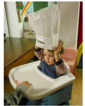
Le poupon doit être intégré dans le groupe d'enfants et il doit pouvoir participer, à sa façon, aux différentes routines et activités de la journée.