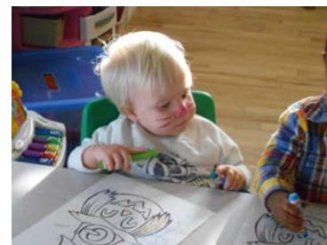
Les plus âgés initient les petits aux jeux et aux activités et ils représentent pour eux des modèles significatifs.