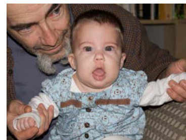
Les bébés associent très tôt les sons et les rythmes des comptines.

Dans tous les apprentissages de l'enfant, les émotions jouent un rôle de premier plan. Le nouveau-né est dépendant de sa mère et la nature particulière de leur relation affective sert de moteur à son développement.