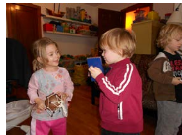
L'enfant construit son identité à travers ses relations affectives aux autres.