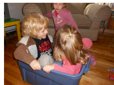
Les comptines favorisent des relations sociales de qualité entre les enfants.